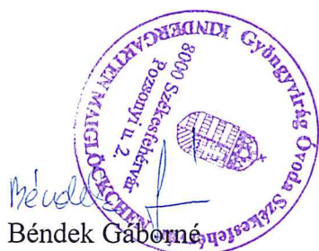
Bédek Gábor óvodaigazgató