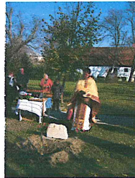
Emlékfa, emléktábla szentelés