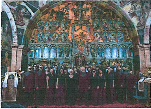
Múzeumok éjszakája: Kórus koncert