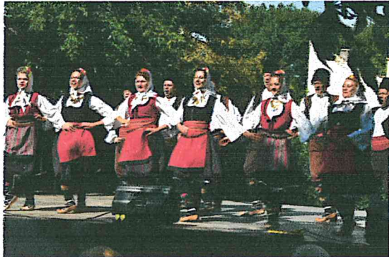
Szerb Nemzetiségi Nap, Rozmarin együttes