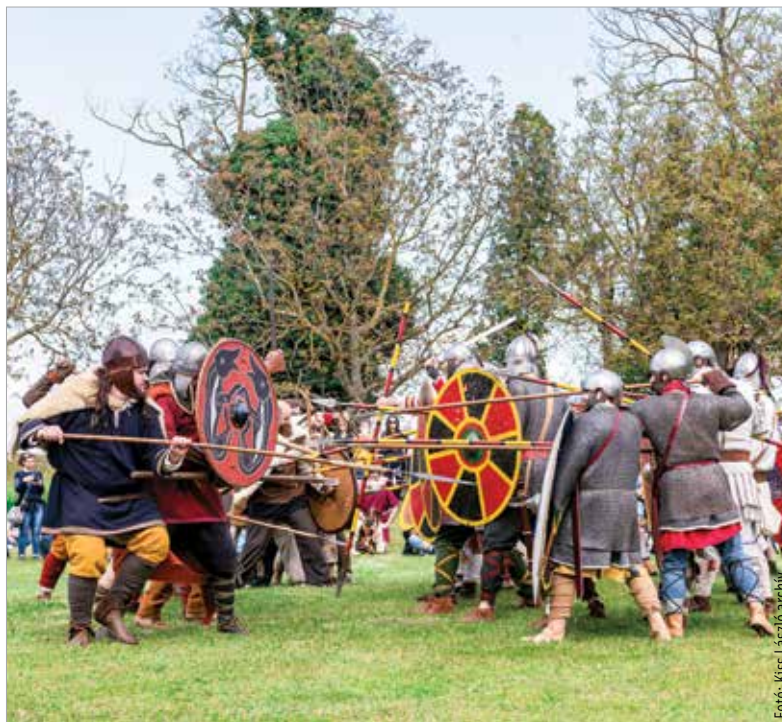
Római fogathajtó verseny, gladiátorviadalok, ókori színház és csatajelenetek színesítik a tavaszközöntő ünnepet