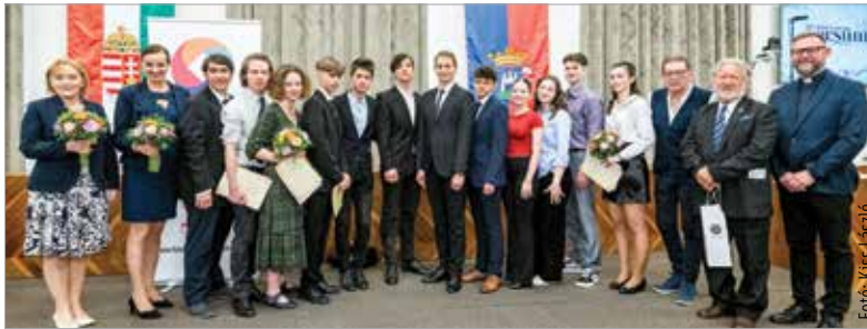
Színpadon a tizenkét döntős és a zsűri