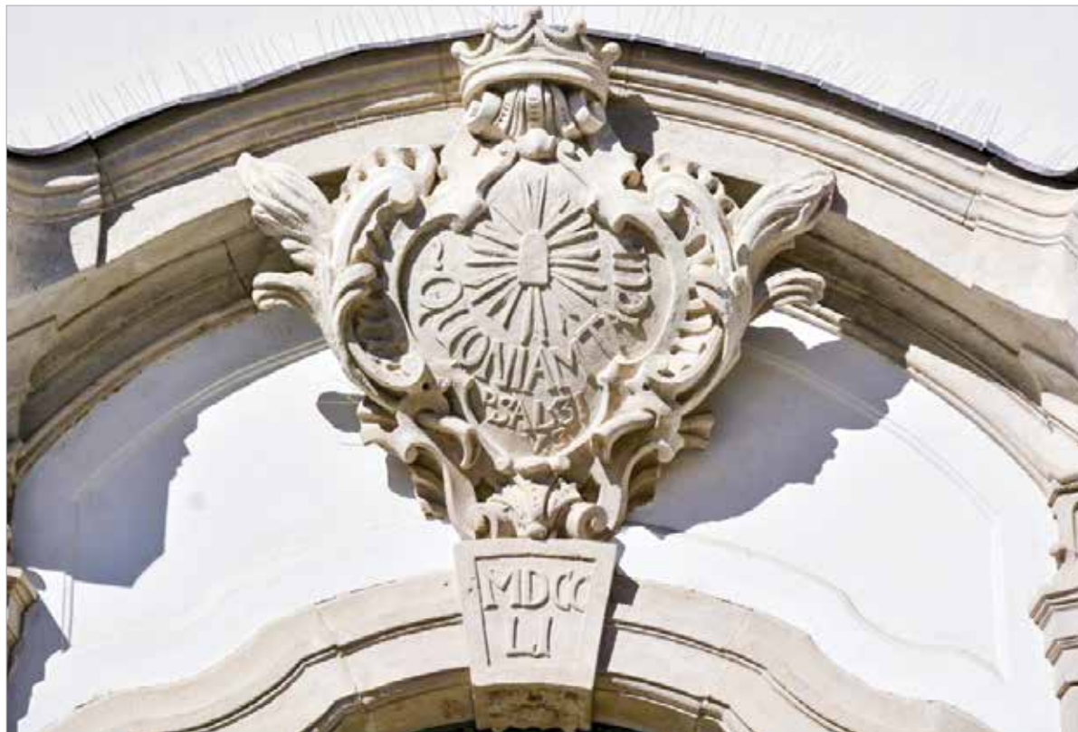
A fehérvári vallási helyek egyik legszebb kapucímere a belvárosi templomot díszíti

A templom története tehát nem nélkülözte a fordulatokat, az állandóságot azonban csodaszép belsője mellett a fehérvári vallási helyek egyik legszebb kapucímere adja. A köztérkép így mutatja be azt: „A kőkeretes kapu barokkosan hajló ívének zárkövében a római évszám (MDCCLI) az építés befejezésére utal, a szemöldökmezőben a templom védőszentjének sugárkoszorúval körülvevett nyelvéreklyéje látható, alatta a latin nyelvű felirat egy zsoltár első két szava, illetve annak száma: „QUONIAM TACUI. PSAL. 31. V. 3.” (Hallgass meg. Zsolt. 31. V. 3.). A kovácsoltvas kapuszárnyak felett pedig a jezsuita címer látható.”