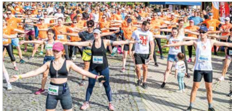
Ezzel a hétvégi programmal indult el a sportos rendezvények időszaka a városban