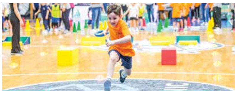
A kisdiákok különböző ügyességi, az atlétika mozgásformáit bemutató feladatokban mérhették össze tudásukat