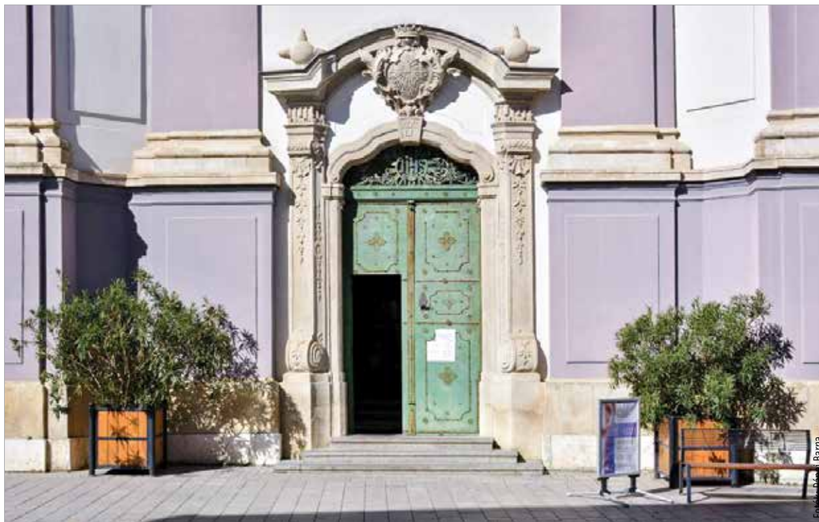
A címer és maga a templom is kiváló állapotban van, így hosszú ideig gyönyörködhetünk még szépségében, részletgazdag kidolgozásában