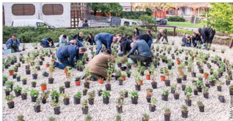
Vigyázzunk a növényekre, hogy minél tovább díszei lehessenek belvárosunknak!

A munkába bekapcsolódott Cser-Palkovics András is, aki elmondta: az elkészült esőkertet akkreditálni fogják a Green City mozgalom keretében. A polgármester szerint a terület kuriózum lesz, egyben jó példa arra is, hogy a város más pontjain is létrehozhatnak hasonlókat civil összefogással. Az elültetett növények várhatóan már idén nyárra kivirágoznak, a szakemberek szerint azonban a kert a végleges arcát a következő egy-két évben nyeri majd el. A területet a terepviszonyokhoz és a növények igényeihez igazodva alakították ki.