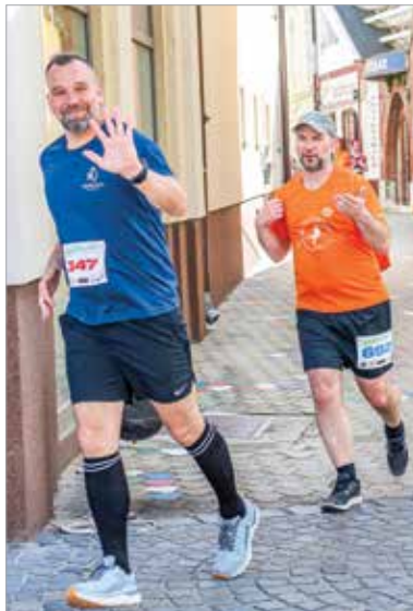
Családok, baráti csapatok is teljesítették a távot