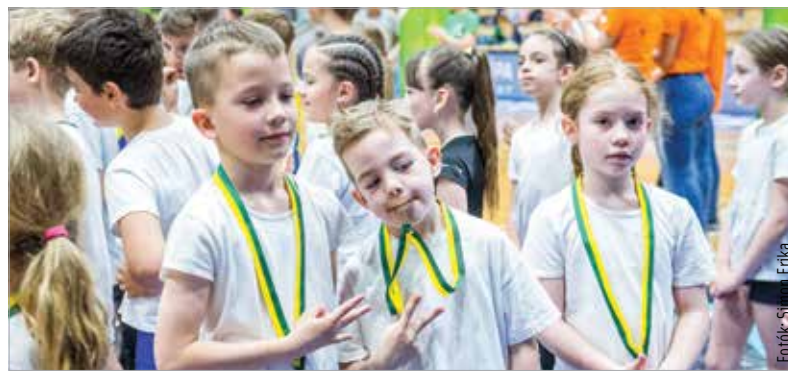
Tizenkét iskola több mint négyszáz diákja lett bajnok, hiszen mindenki nyakába érem került!