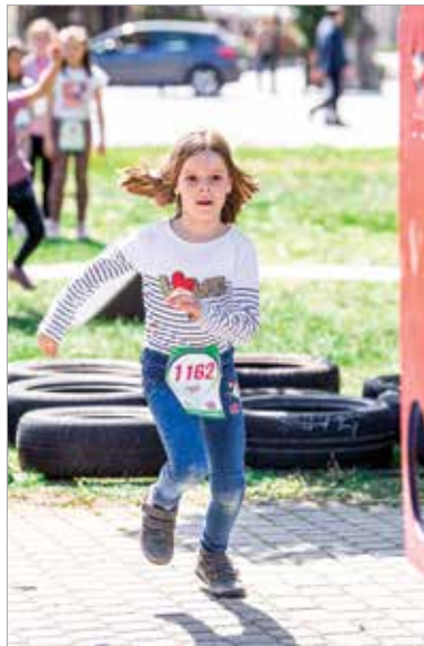
Ügyességi pályák is várták a lelkes fiatalokat

A futás szerelmesei és lelkes szurkolók töltötték meg Fehérvár utcáit vasárnap. Az idei első sportos hétvége igen jól sikerült, több mint nyolcszázán álltak rajthoz a IX. Cerbona Fehérvár Félmaratonon. Szikrázó napsütésben, tapsoló, biztató szavakat kiabáló családtagok és barátok gyűrűjében rótták a város utcáit mindazok, akik részt vettek a minden évben igen népszerű rendezvényen. Már péntektől programok várták a Zichy ligetbe érkezőket, vasárnap délelőtt pedig több távon és kategóriában a futóverseny résztvevői is elrajtoltak.