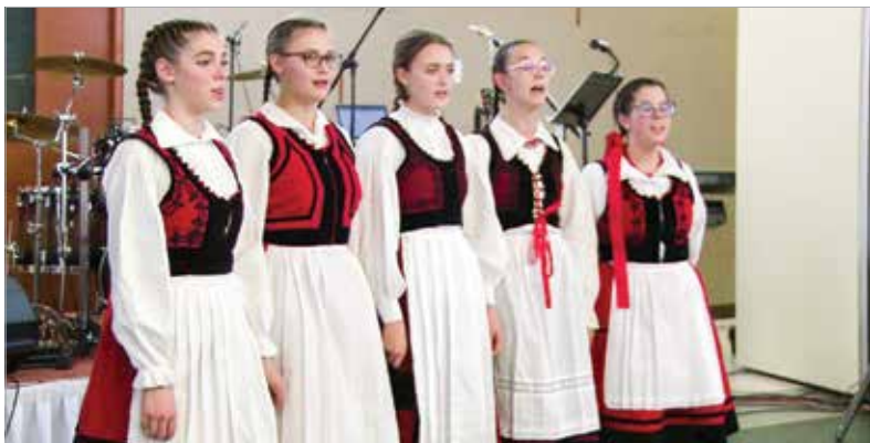
A székely kultúra kapta a főszerepet április tizenharmadikán, szombaton a Magyar Király Szállóban. Az esemény ezúttal is jó célt szolgált, hiszen a bevételből Mórfehérvárt, illetve a Kárpáti Igaz Szó című hetilapot támogatják.